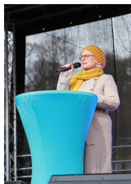
Kundgebung in Erfurt