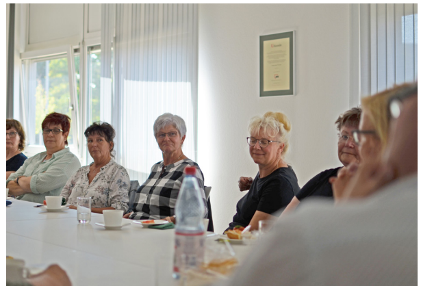
Die Leiterinnen der AWO-Begegnungsstätten im Landkreis Saalfeld-Rudolstadt im Austausch zum Jahresthema