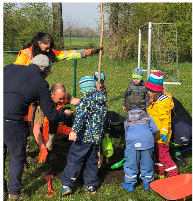
April 2022: Dreh für die Ehrenamtskampagne beim AWO Kreisverband Erfurt / AWO Förderverein „Abenteuerland“