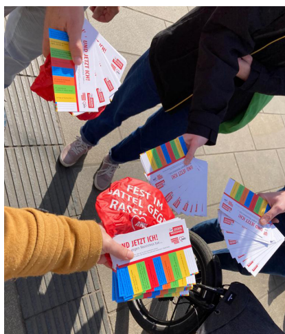
März 2022: AWO gegen Rassismus

Erstmals initiierte die AWO im Berichtszeitraum eine Stolpersteinverlegung. In Kooperation mit der AWO Sachsen-Anhalt und der AWO im Altenburger Land wurde in Altenburg ein Stolperstein vor dem ehemaligen Wohnhaus der im Widerstand aktiven Familie Fröhlich verlegt.