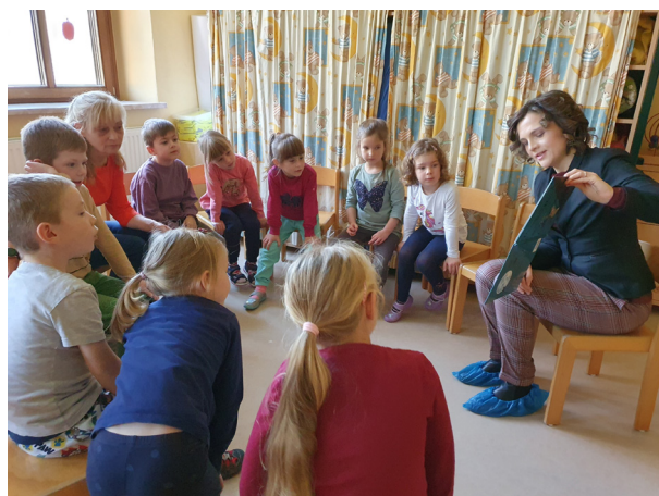
Vorleseaktion mit der Bundestagsabgeordneten Elisabeth Kaiser in Caaschwitz