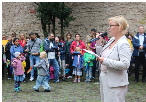
September 2022: Aktionstag Sprach-Kitas in Jena

Im Juli 2022 informierte das Bundesministerium für Familie, Senioren, Frauen und Jugend (BMFSFJ) über das Ende des Bundesprogramms „Sprach-Kitas: Weil Sprache der Schlüssel der Welt ist“. Allein bei der AWO Thüringen sind rund 60 Kindergärten Sprach-Kitas. In jeder dieser Einrichtungen wird eine zusätzliche Fachkraft mit 20 Stunden/Woche über das Programm refinanziert. Eine deutschlandweite Kampagne und Petition, an der sich auch die AWO Thüringen beteiligte, brachte das Thema erfolgreich in die überregionalen Medien und bewirkte eine Übergangsfrist, bis die Länder die Refinanzierung des Programmes übernahmen.