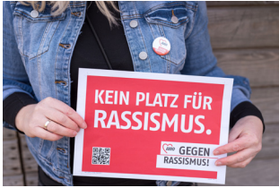
März 2021 AWO gegen Rassismus