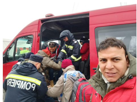
Rettungsaktion für Geflüchtete