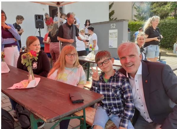
Juli 2022: 20 Jahre AWO Kinder- und Jugendheim „Am Ringelberg“ in Erfurt

Quarantäne-bedingte vorübergehende Schließungen haben auch 2022 die Zusammenarbeit mit den Eltern beeinträchtigt. Daher wurde die Vorbereitung für eine Implementierung einer Kindergarten-App in verschiedenen Gliederungen forciert. Außerdem wurden die Arbeitshilfen „Eingliederungshilfe für Integrative Kindergärten“ und „Erarbeitung einrichtungsbezogener Kinderschutzkonzepte“ fertiggestellt. Immer mehr Kindergärten der AWO Thüringen beteiligen sich am Landesprogramm „Vielfalt vor Ort begegnen – professioneller Umgang mit Heterogenität in Kindertageseinrichtungen“ oder entwickeln sich zu Thüringer Eltern-Kind-Zentren (TheKiZ) weiter. Im Herbst 2022 hat der AWO Landesverband Thüringen eine umfassende Kampagne zum Erhalt des Programmes „Sprach-Kitas“ durchgeführt und eine entsprechende Petition an den Deutschen Bundestag unterstützt.