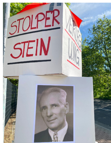
Mai 2022: Stolpersteinverlegung