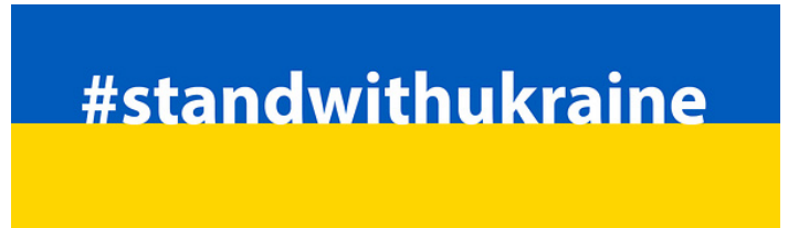
Februar 2022 Kriegsbeginn in der Ukraine, Start der AWO-Hilfsaktionen