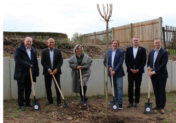
April 2022: Start eines Wohnprojektes für Menschen mit Behinderung der AWO Saale-Orla in Pößneck

arbeit ein, um die Rahmenbedingungen für den Betrieb der Schulen zu optimieren.