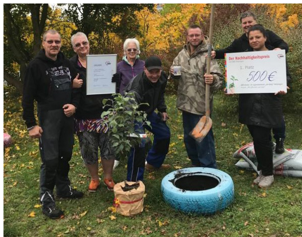
Oktober 2022: Der Nachhaltigkeitspreis geht an den AWO Jugendclub „Am Berg“ in Meiningen