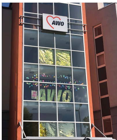
Mai 2022: GOLD STATT BRAUN