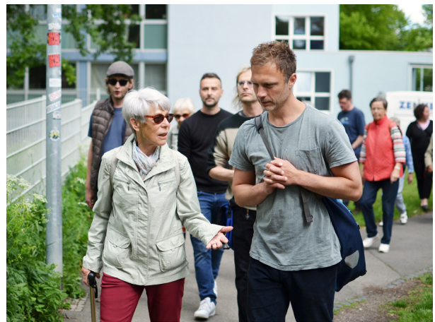
Quartiersrundgang in Weimar-Nord im Rahmen des AWO-Jahresthemas 2022

Auch zukünftig wird die AWO Thüringen mit einem Schwerpunktthema durch das Jahr gehen: Per Beschluss wurde auf der Landeskonferenz 2022 in Erfurt einstimmig beschlossen, dass es von 2022 bis vorerst 2025 jeweils ein inhaltliches Jahresthema geben wird. Damit möchte die AWO ihr Profil stärken, sich noch mehr als bisher einmischen und ihre Expertise in verschiedenen Bereichen nutzen und ausbauen.