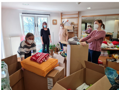
Spendensammlung für die Ukraine