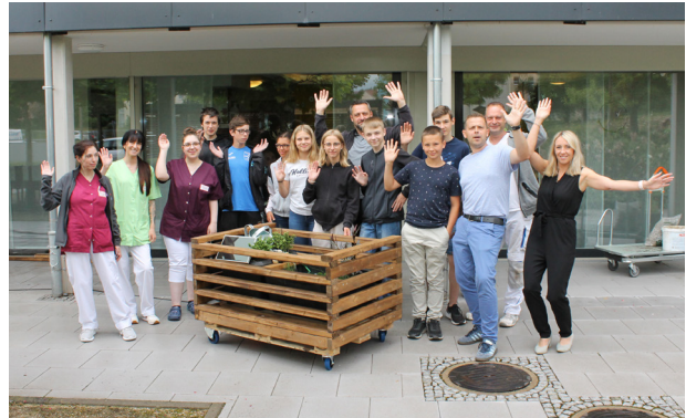
September 2022: Schülerfreiwilligentag in der AWO Seniorenresidenz „Haus am Wippertor“ in Sondershausen

2022 haben sich drei AWO-Standorte am Schülerfreiwilligentag beteiligt. Rund 25 Schülerinnen und Schüler waren in den AWO Seniorenresidenzen in Sondershausen und Gera sowie in der AWO Tagespflege in Neuhaus am Rennweg aktiv.