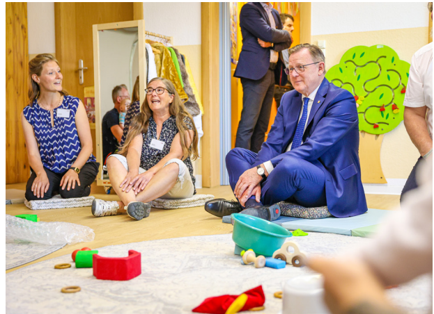
Juni 2022: Ministerpräsident Ramelow zu Besuch im TheKiZ der AWO in Eisenach

Die Mitarbeitenden der Jugendzentren haben verstärkt auf mobile und aufsuchende Arbeit gesetzt, um den Folgen der Pandemie entgegenzuwirken. Gezielte Projektarbeit und Feriengestaltung sind neben der täglichen offenen Arbeit die zentralen Tätigkeitsfelder. Beteiligungsformate wie das Jugendforum werden in der Arbeit mit den Kindern und Jugendlichen immer wichtiger. Vorhandene Corona-Aufholprogramme wurden genutzt, um die Einrichtungen zum Beispiel mit neuer Technik auszustatten. Die Kooperation mit der Schulsozialarbeit hat sich als immer wichtigerer Faktor herausgestellt. Die Jugendzentren sind auch weiterhin an der Fortschreibung der Jugendförderpläne der Landkreise beteiligt.