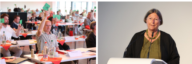
Mai 2022 Landeskonzferenz der AWO Thüringen in Erfurt