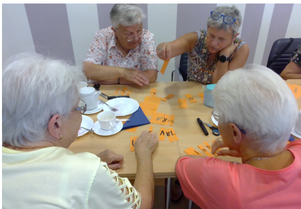
Nachmittag zum Jahresthema in der AWO-Begegnungsstätte Gräfenroda