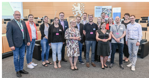
Juni 2022: AWO-Delegation auf der Konferenz im Thüringer Landtag

Am 23. Juni 2022 fand im Thüringer Landtag eine gemeinsame Konferenz von AWO Thüringen, Paritätischem Thüringen und BUND Thüringen zur sozial-ökologische Transformation statt. Die Tagung stand offen für Expert*innen aus Wirtschaft, Politik und Verbänden. Die Veranstaltung beleuchtete die sozial-ökologische Transformation aus Sicht einer sozialen Dienstleisterin: Ein nachhaltig agierender Staat muss die Menschen mitdenken und den Akteurinnen der Wohlfahrtspflege die passenden Rahmenbedingungen bereiten, von Fördermöglichkeiten bis hin zu barrierearmen, nachhaltigen Angeboten für jeden Geldbeutel.