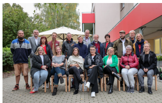
September 2022 Klausur der Geschäfts- führenden in Altenburg