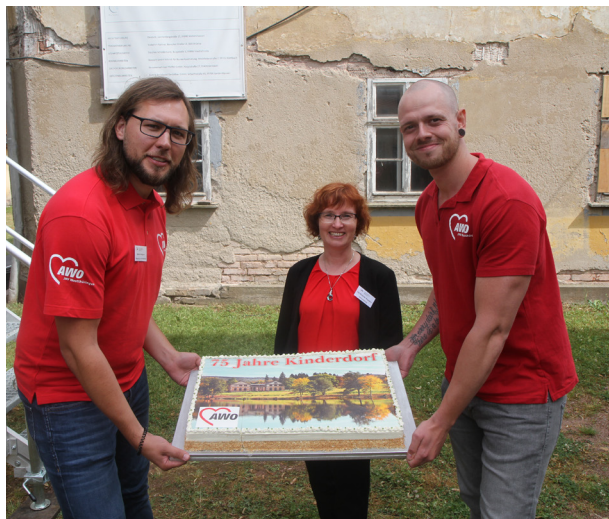
Juli 2022: Ein AJS-Highlight in 2022 war das 75-jährige Bestehen des Kinderheimbetriebes in Westthüringen

welche in eine Förderung ab 2023 mündete. Über fachliche Stellungnahmen und die Mitwirkung in Arbeitsgruppen auf Bundes- und Landesebene beteiligte sich das IBS insbesondere an aufenthaltsrechtlichen Themen wie bspw. der Einführung des Chancenaufenthaltsrechts für Menschen mit Duldung.