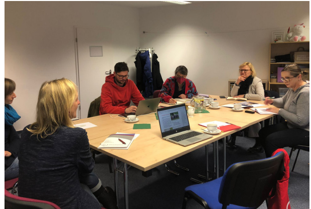
Dezember 2022: Das IBS stellte seine Arbeit der Funke Medien Gruppe vor

2022 war für die IBS ein sehr spannendes Jahr. Der Europäische Sozialfonds startete in die nächste Förderrunde. Damit verbunden beteiligte sich das IBS an der Ausschreibung für drei große Bundesprogramme: Integration durch Qualifizierung , MYTURN – Migrantinnen starten durch und WIR – Netzwerke integrieren Geflüchtete in den regionalen Arbeitsmarkt . Für alle erhielt das IBS den Zuschlag. Mit dem Angriffskrieg Russlands auf die Ukraine gab es einen enormen Anstieg der Beratungszahlen insbesondere in der Anerkennungsberatung. Seit 2022 ist das IBS AZAV-zertifiziert. Damit können ausländische Fachkräfte einen Bildungsgutschein von der Agentur für Arbeit erhalten, um beim IBS eine Anpassungsqualifizierung für Gesundheitsberufe zur Vorbereitung auf die Kenntnisprüfung beim Thüringer Landesverwaltungsamt zu absolvieren. Über die Anpassungsqualifizierung für zugewanderte pädagogische Fachkräfte ergab sich eine sehr gute Zusammenarbeit mit der Robert-Bosch-Stiftung,