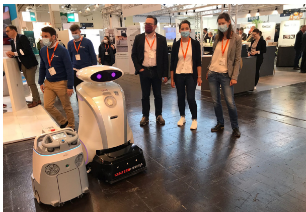
April 2022: AWO-Delegation auf der Messe ALTENPFLEGE

Fortlaufendes Thema war die Umsetzung der generalisierten Pflegeausbildung. Im Fokus standen hier erneut die Verfahren zur Datenmeldung für das Finanzierungsjahr 2023.