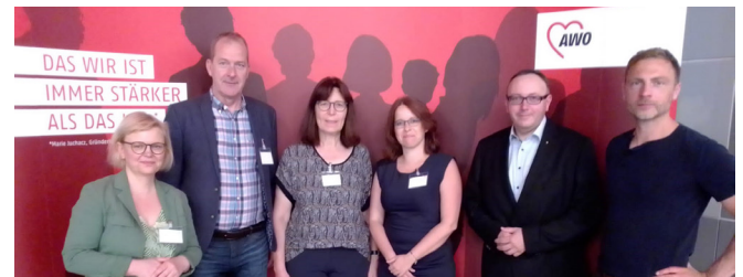
Juni 2022 Sozialkonferenz des AWO Bundesverbandes in Dortmund