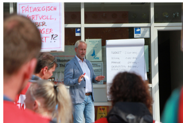
September 2022: Die Geschäftsführer der AWO-Schulträger und Teilnehmende einer GEW-Demonstration im Austausch

Die AWO und ihre Schwangerschaftskonfliktberatungsstellen haben 2022 eine Stellungnahme zur Neuregelung des Schwangerschaftsabbruchs außerhalb des Strafgesetzbuches erarbeitet. Außerdem hat die AWO sich für die Finanzierung der Verwaltungsfachkräfte in den Beratungsstellen außerhalb der Sachkosten eingesetzt. Die Einrichtungen haben ihre Arbeit in den sozialen Netzwerken verstärkt. Die Versorgung von Schwangeren in einigen Thüringer Landkreisen ist sehr angespannt.