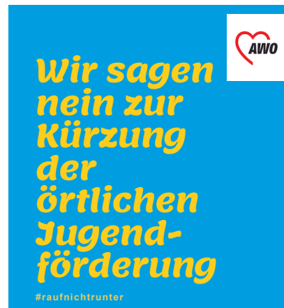
2022: Kampagne #raufnichtrunter zum Landshaushalt 2023

Das Landesjugendwerk hatte in 2022 15 hauptamtlich Beschäftigte und zwei Bundesfreiwillige. Insgesamt wurden 120 Freiwillige im FSJ und 33 Bundesfreiwilligendienstleistende betreut. Vor allem im Bereich BFD der über 27-Jährigen brachen die Zahlen im Berichtszeitraum ein. Daraufhin ist eine öffentlichkeitswirksame Kampagne zur Bewerbung der Freiwilligendienste entwickelt worden. Eine weitere Kampagne ist gegen die geplanten (und später zurückgenommenen) Kürzungen des Landes bei der örtlichen Jugendförderung entstanden. 2022 hat das Jugendwerk sieben Ferienfreizeiten durchgeführt oder gefördert und zehn Jugendleiter*innen qualifiziert. Verschiedene Gliederungen der AWO Thüringen wurden zum Aufbau von Stadt- bzw. Ortsjugendwerken beraten. Die Veranstaltungsreihen des Jugendwerks litten insbesondere zu Jahresbeginn noch unter den Einschränkungen der Corona-Pandemie. Ende 2022 wurde der Arbeitskreis Gedenkstättenfahrten gegründet,