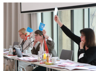
November 2022 Landesausschuss der AWO Thüringen in Erfurt