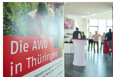
Mai 2022 Kreisvorsitzendentreffen in Zeulenroda-Triebes