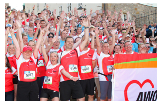
Juni 2022 RUN Unternehmenslauf mit 300 AWO-Läufer*innen